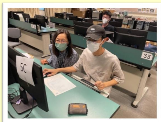
中學文憑試放榜個別輔導